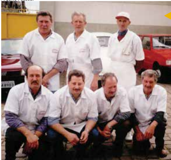
Equipe de Churrasqueiros de 1999